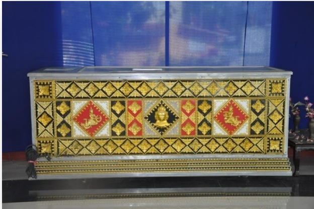
๔) หีบศพแช่เย็น