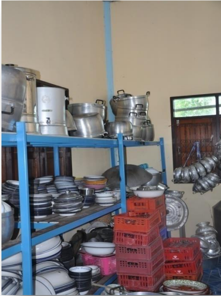
๓) ของใช้เบ็ดเตล็ด