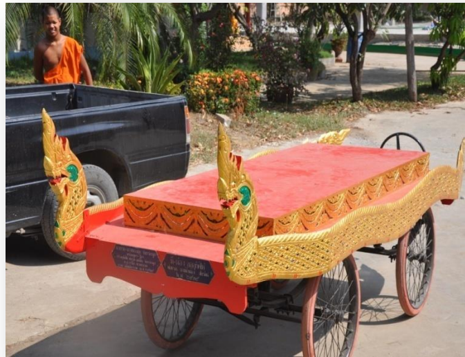
๕) รถบรรทุกศพ