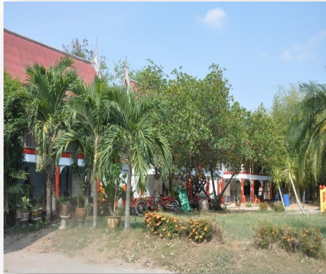
๔) กุฏิพระภิกษุจำพรรษา