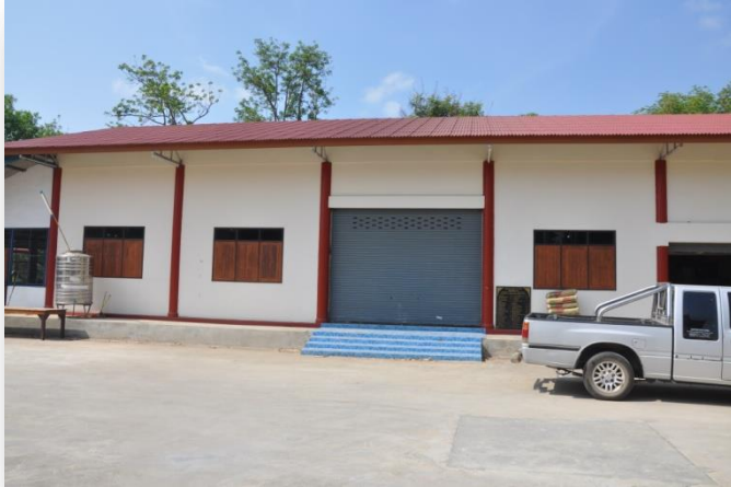
๙) หอฉันภัตตาหาร