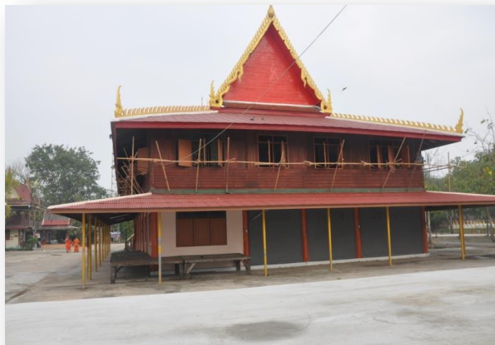
๕) ศาลาการเปรียญ