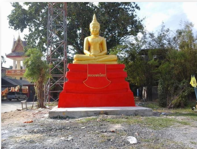
๑๑) หลวงพ่อโสธร