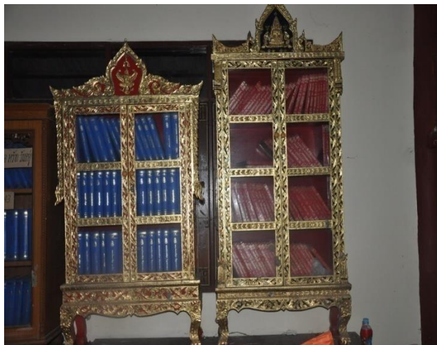
๖) ตู้พระไตรปิฎก - ตู้พระธรรม