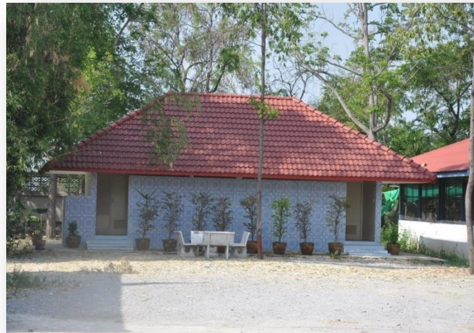
๑๐) ห้องสุขา ชาย - หญิง