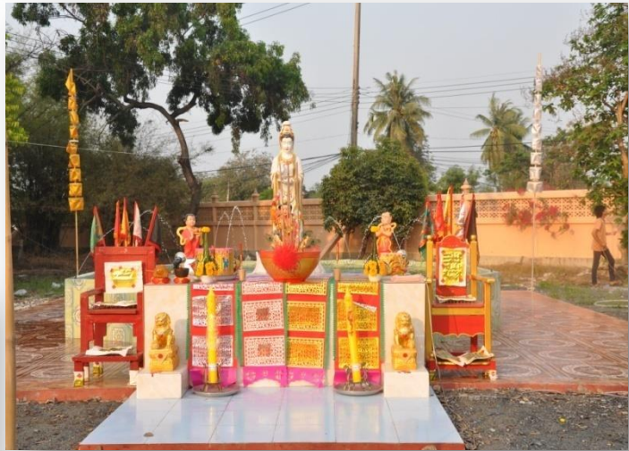
๑๓) พระโพธิสัตว์กวนอิม