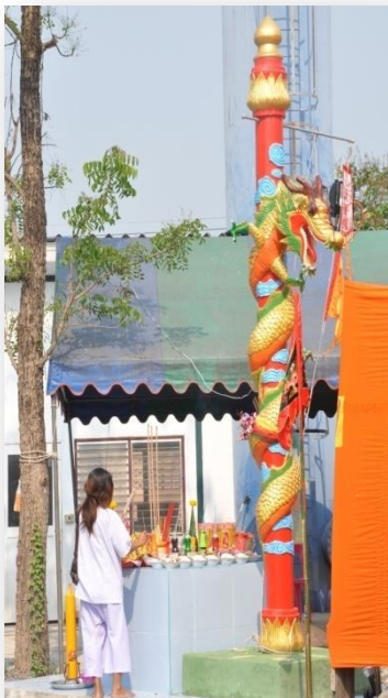
๑๔) เสามังกร หรือ เสาทวดาฟ้าดิน