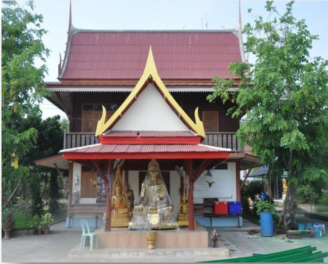
๓) กุฏิทรงไทย