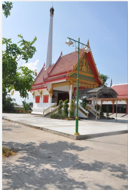
๗) เมรุวัดโฆสิตาราม