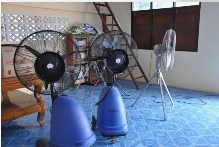
๔) พัดลมไอน้ำ