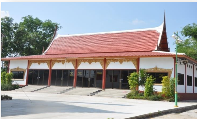
๘) ศาลาบำเพ็ญกุศล