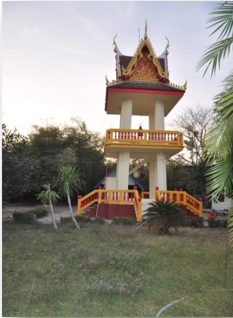
๖) ทอระฆัง