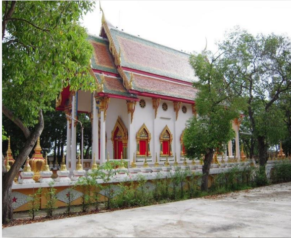
๑) พระอุโบสถวัดโฆสิตาราม