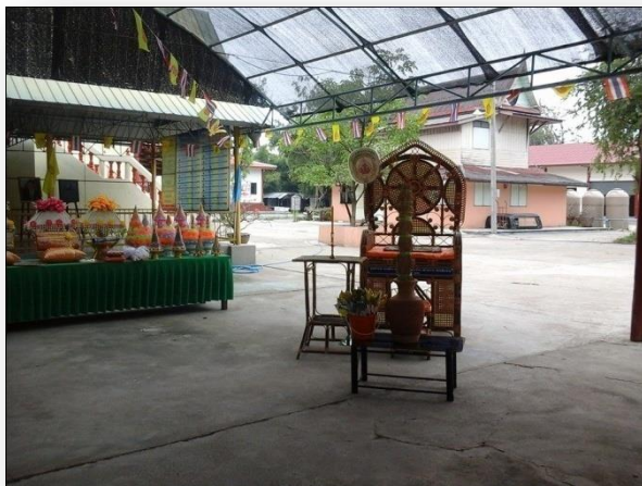
๓) ธรรมมาสน์หวาย