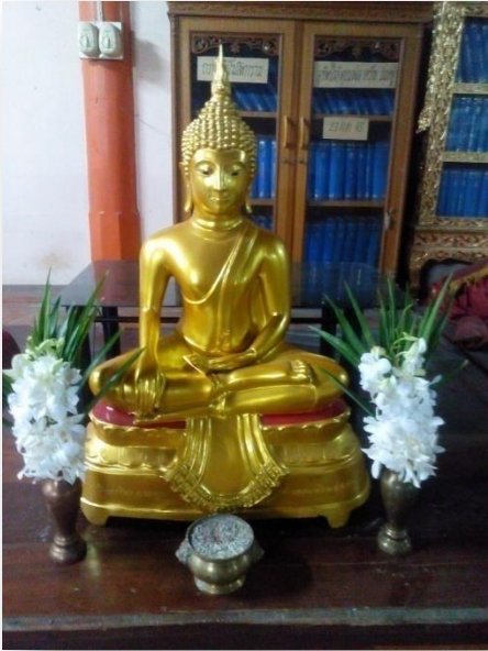
๑) พระพุทธรูป