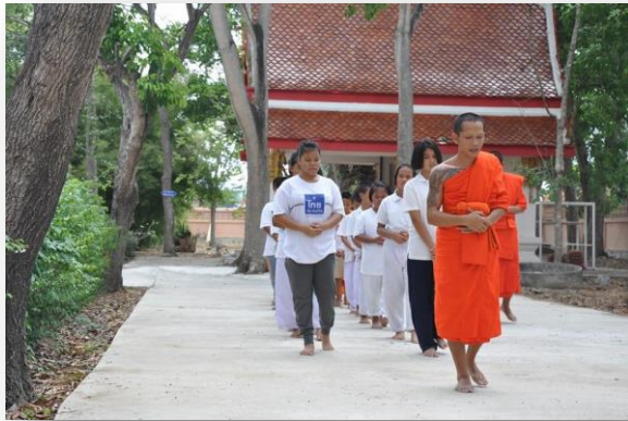
๓) โครงการเข้าค่ายปฏิบัติ ธรรม วิปัสสนากรรมฐาน โรงเรียน บ้านไผ่คอกว้าว