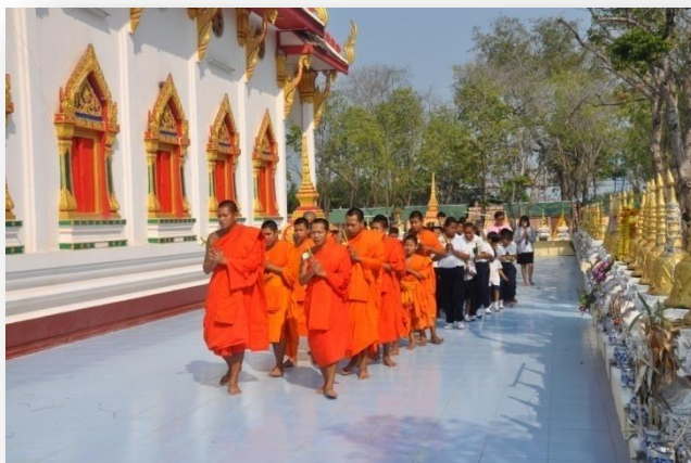
๔) กิจกรรมวันสำคัญ ทางพระพุทธศาสนา ได้นำเด็ก นักเรียนบ้านไผ่คอกว้าวทำ กิจกรรม ฟังเทศน์ สวดมนต์ และปฏิบัติธรรม