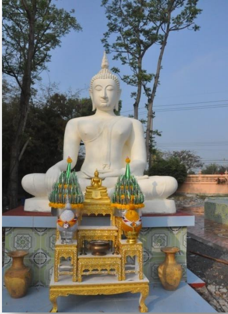
๑๒) หลวงพ่อสุโขทัย